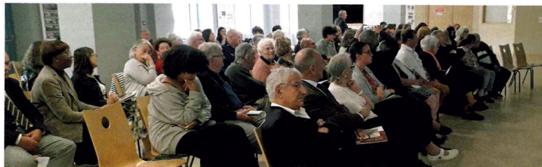
L'assistance lors des conférences à Aubusson.