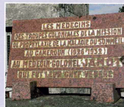
Plaque commémorative (1967).

Nous nous sommes séparés après un déjeuner au Relais des Forêts à Blessac en espérant nous retrouver en ces lieux en 2026.