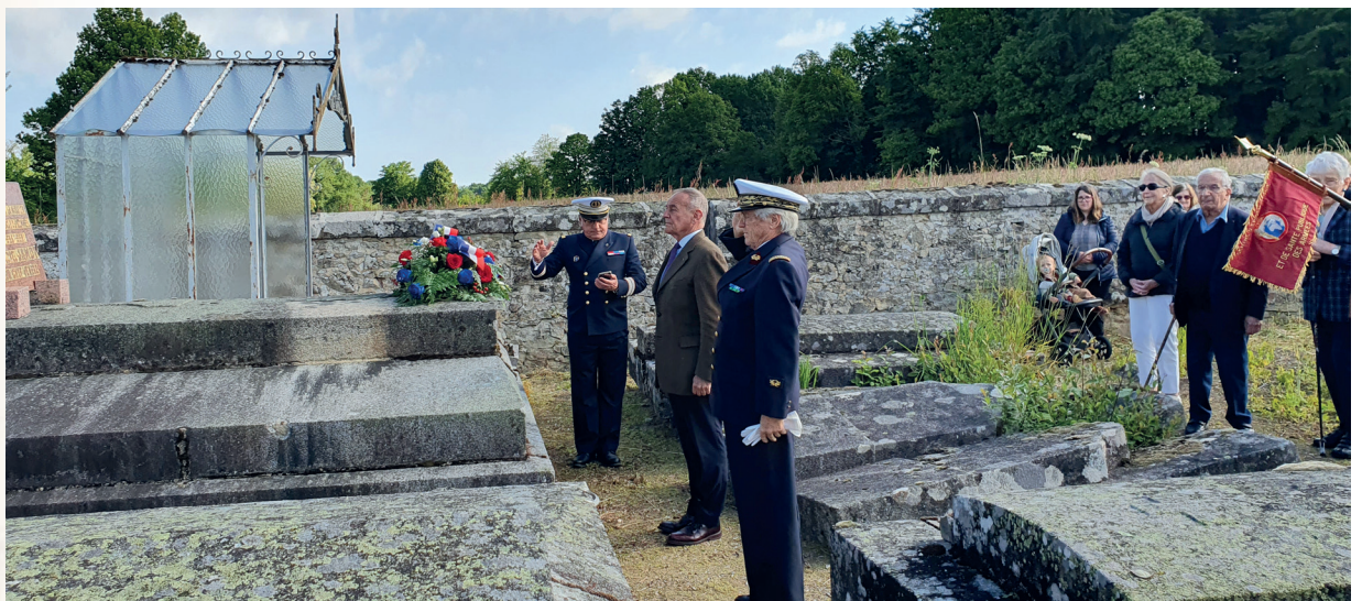
Cérémonie devant la tombe du Dr. Jamot – honneurs militaires