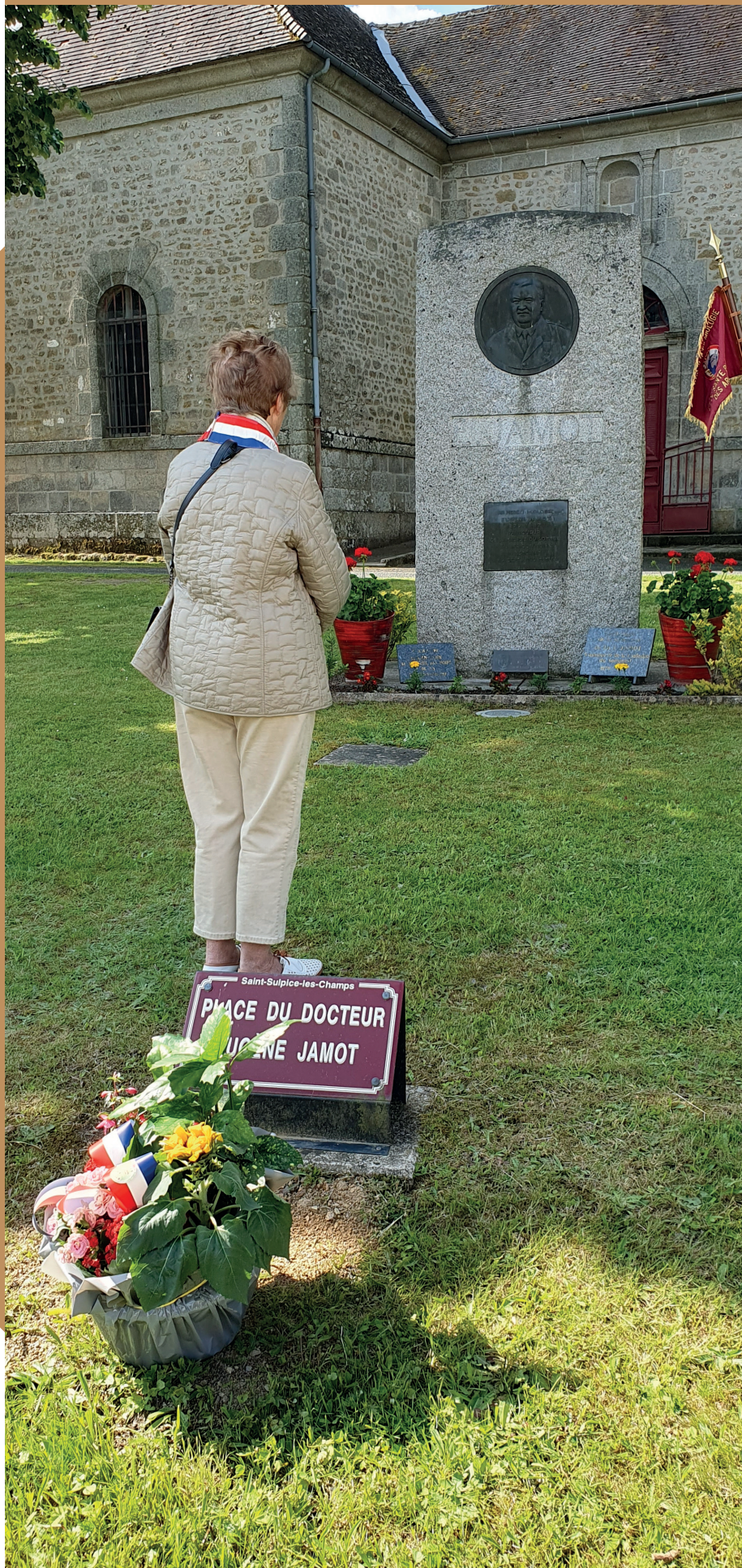
Mme le Maire de Saint Sulpice les Champs devant la stèle de Jamot