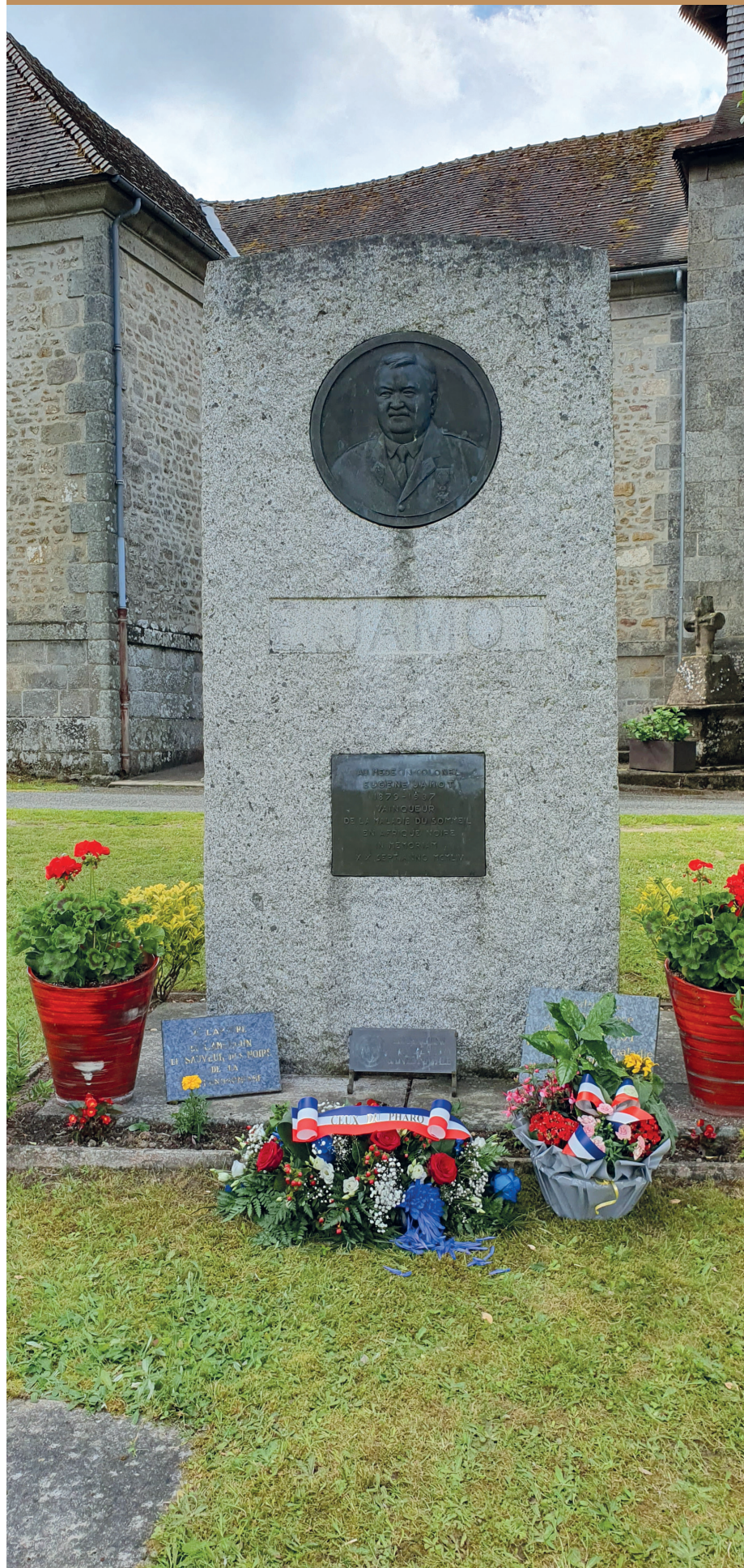
La stèle du Dr Eugène Jamot devant l'église de Saint Sulpice les Champs