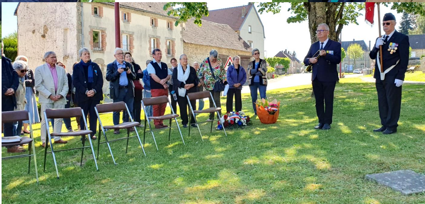
Des participants à la cérémonie – Drapeau des Anciens combattants