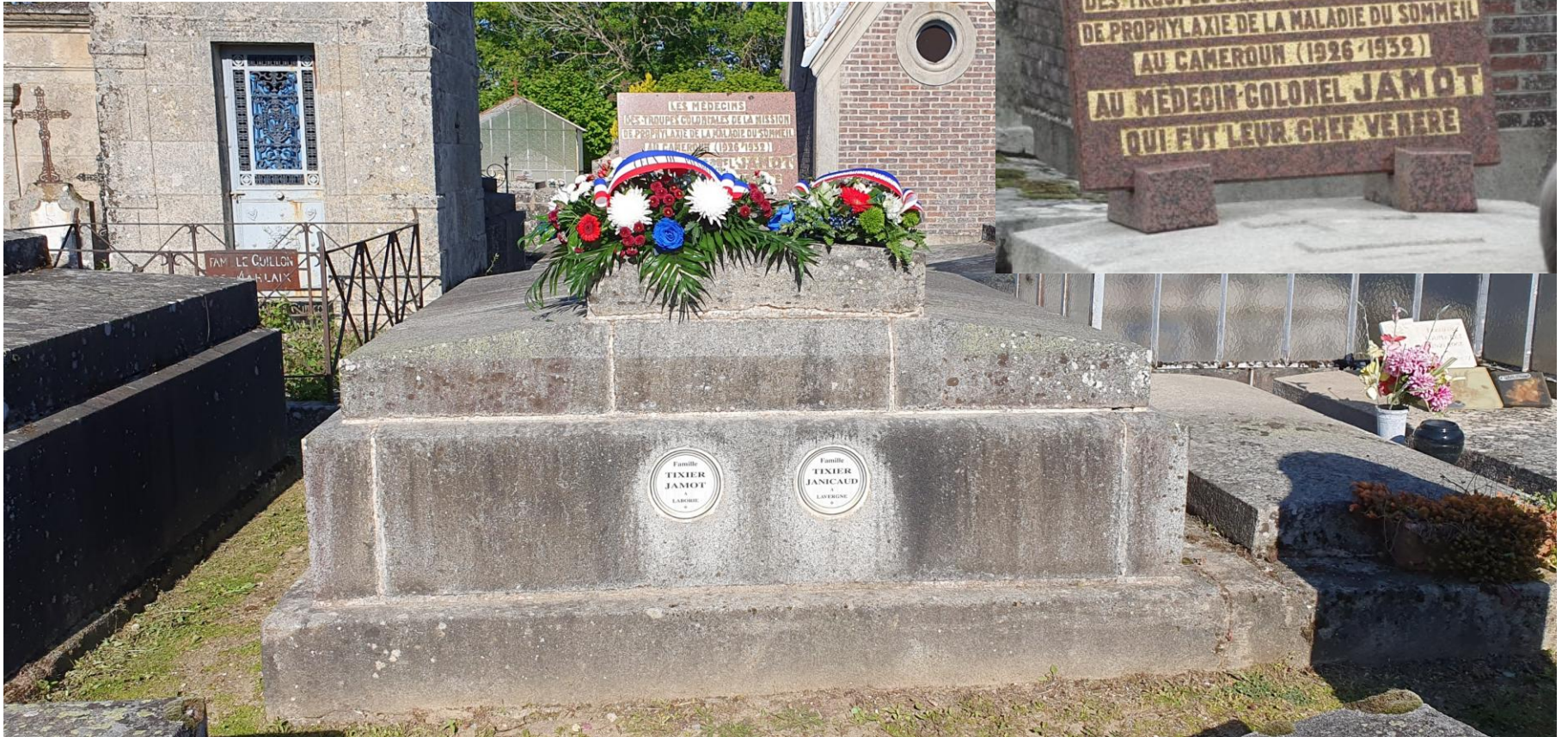
La sépulture du Dr Eugène Jamot