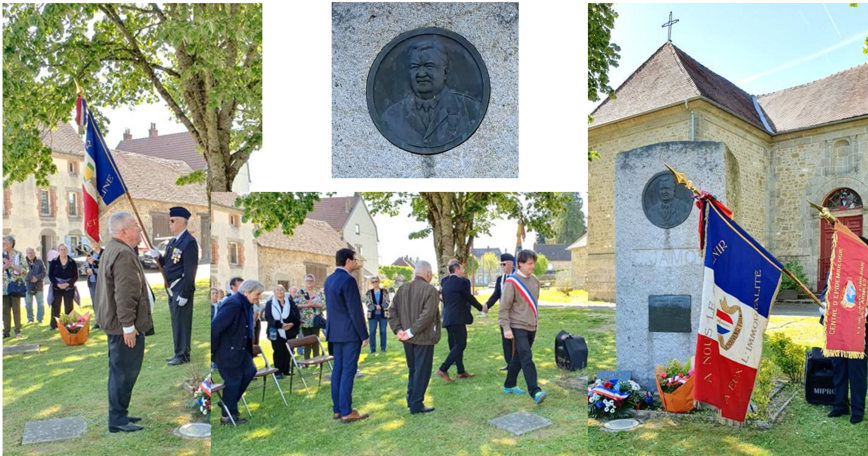
Recueillement et minute de silence devant la stèle du Dr. Jamot