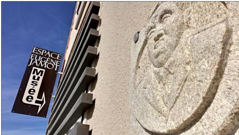
Ci-dessus à gauche : L'Espace Eugène Jamot à Saint Sulpice les Champs (23)