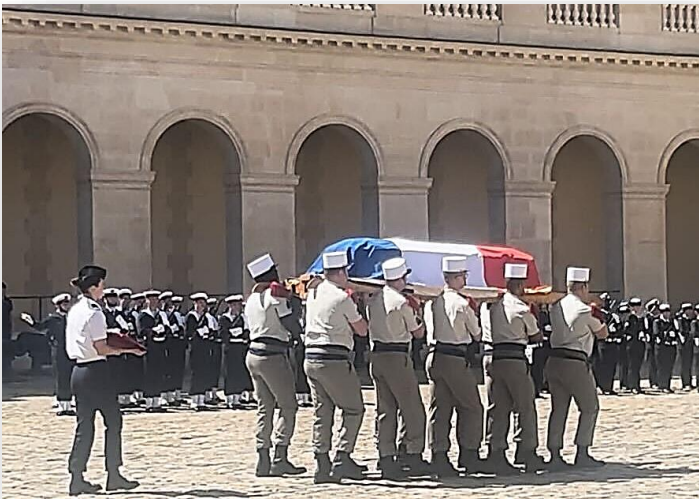
7 juin 2024. Dans la Cour d'honneur des Invalides

Décédée le 30 mai 2024 à l'âge de 99 ans, sa messe de funérailles s'est déroulée en la Cathédrale Saint-Louis des Invalides - l'église des soldats - le vendredi 7 juin 2024.