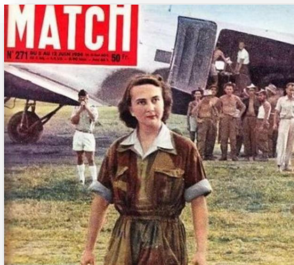
G. de Galard sur le terrain de Luang Prabang (Laos) après sa libération le 24 mai 1954