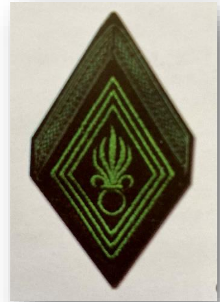
Galon de 1 ère classe de la Légion étrangère

Geneviève de Galard est la seule femme à avoir eu l'exceptionnel honneur de remonter la Voie sacrée de la maison-mère de la Légion étrangère à cette occasion.