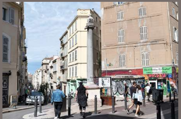
©Jean de Peña/ Photographie tirée de l'exposition Atour de La/Ma Rue

> RDV entrée du musée côté Centre Bourse