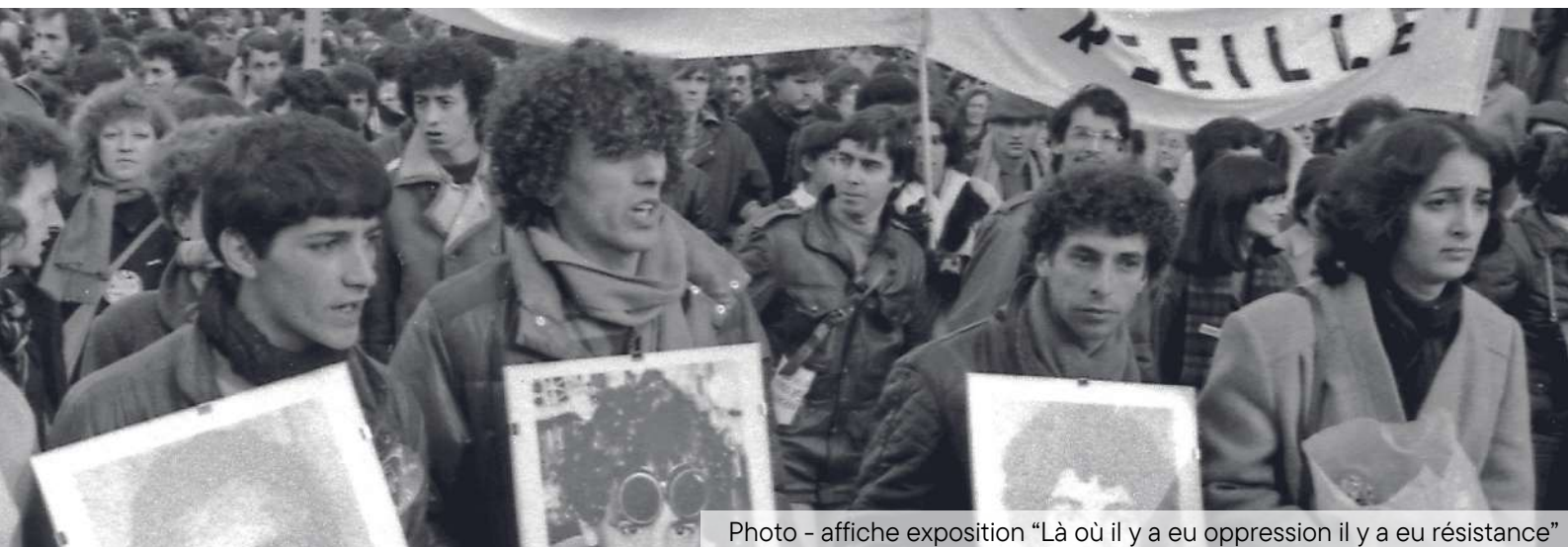
Photo - affiche exposition "Là où il y a eu oppression il y a eu résistance"

TOUTE L'ÉQUIPE DU MUSÉE D'HISTOIRE DE MARSEILLE VOUS SOUHAITE DE BONNES FÊTES DE FIN D'ANNÉE !