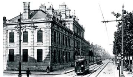
Bordeaux - Ecole de Santé Navale Cours de la Marne