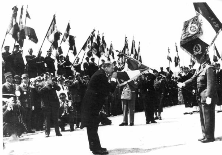
1957 : Le Président de la République René Coty remet la Légion d'Honneur au drapeau de l'école du Pharo