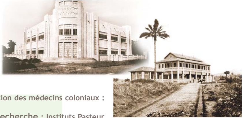
Institut Pasteur de Kindia, Pastoria, Guinée Française.