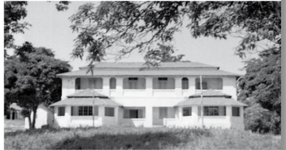
Centre médical de Lambaréné en 1952