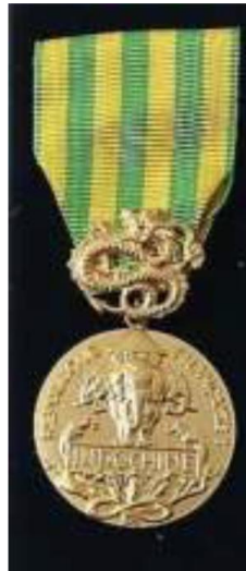
Médaille commémorative Campagne d'Indochine