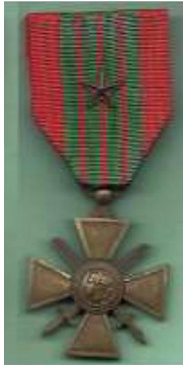
Croix de guerre 39-45 avec étoile de bronze