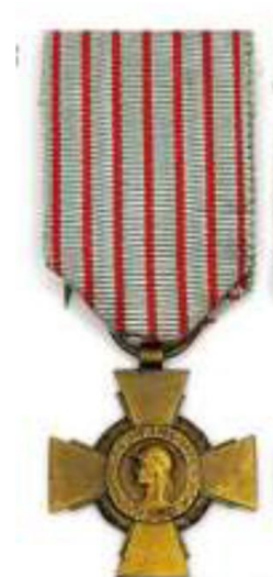
Croix du combattant