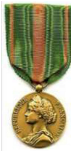
Médaille des Évadés