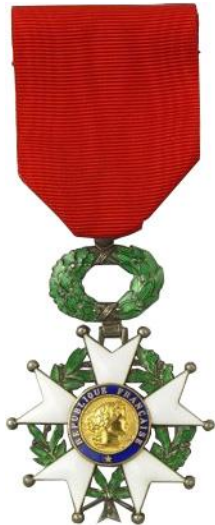
Chevalier Légion d'Honneur

Il avait été fait chevalier de la Légion d'Honneur, reçu la Croix de guerre 39-45 avec étoile de bronze, la Croix de guerre des TOE avec étoile de bronze, la Croix du Combattant, la Médaille d'Outre-Mer Extrême-Orient, La Médaille commémorative de la Campagne d'Indochine, la Médaille commémorative de la Guerre 39-45, la Médaille des Evadés, les médailles de la Compagnie saharienne du Tidikelt In Salah, du 4 e Bataillon de Marche en Extrême-Orient, du Service de Santé des Troupes coloniales, du Territoire des Oasis.