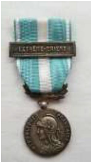
Médaille outre-mer agrafe Extrême-Orient