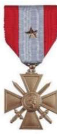
Croix de guerre des TOE avec étoile de bronze