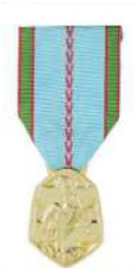
Médaille commémorative Guerre 39-45