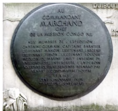
La mission Congo-Nil sur la façade du Palais de la Porte Dorée