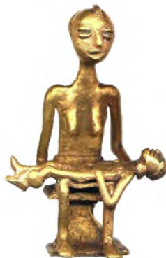
Pisnoni pissono, statuette évoquant la méningite