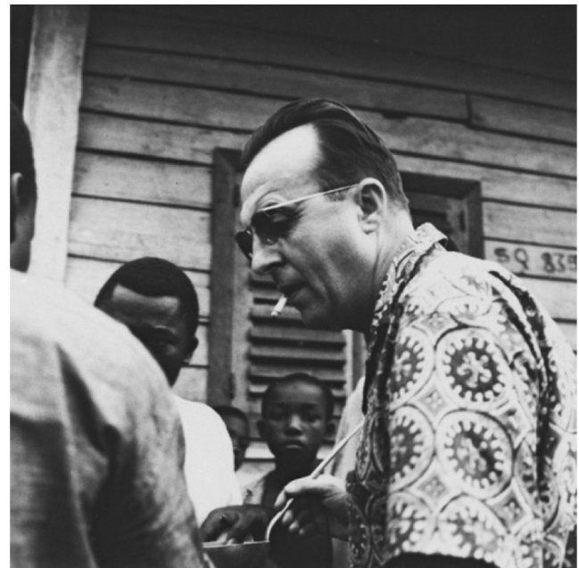
Fig. 1 Cameroun, 1975 – Enquête paludisme © IRD / Cameroon, 1975 – Malaria enquiry © IRD

Puis, porté par le goût de la découverte et du monde tropical, il abandonne un métier sûr et rémunérateur pour intégrer l'ORSOM (Office de la recherche scientifique outre-mer) en 1952. Cet organisme avait été créé par un décret du 11 juin 1942 et la loi du 11 octobre 1943 qui faisaient suite à la volonté exprimée en 1937 par le gouvernement Blum d'avoir un organisme capable de promouvoir la recherche dans les colonies françaises. L'Office de la recherche scientifique coloniale (ORSC) était né. Cette création sera confirmée par une ordonnance du gouvernement provisoire de la république française en date du 24 novembre 1944 et l'organisme changera rapidement de nom pour devenir en juin 1949 l'ORSOM puis l'ORSTOM (Office de la recherche scientifique et technique outre-mer) le